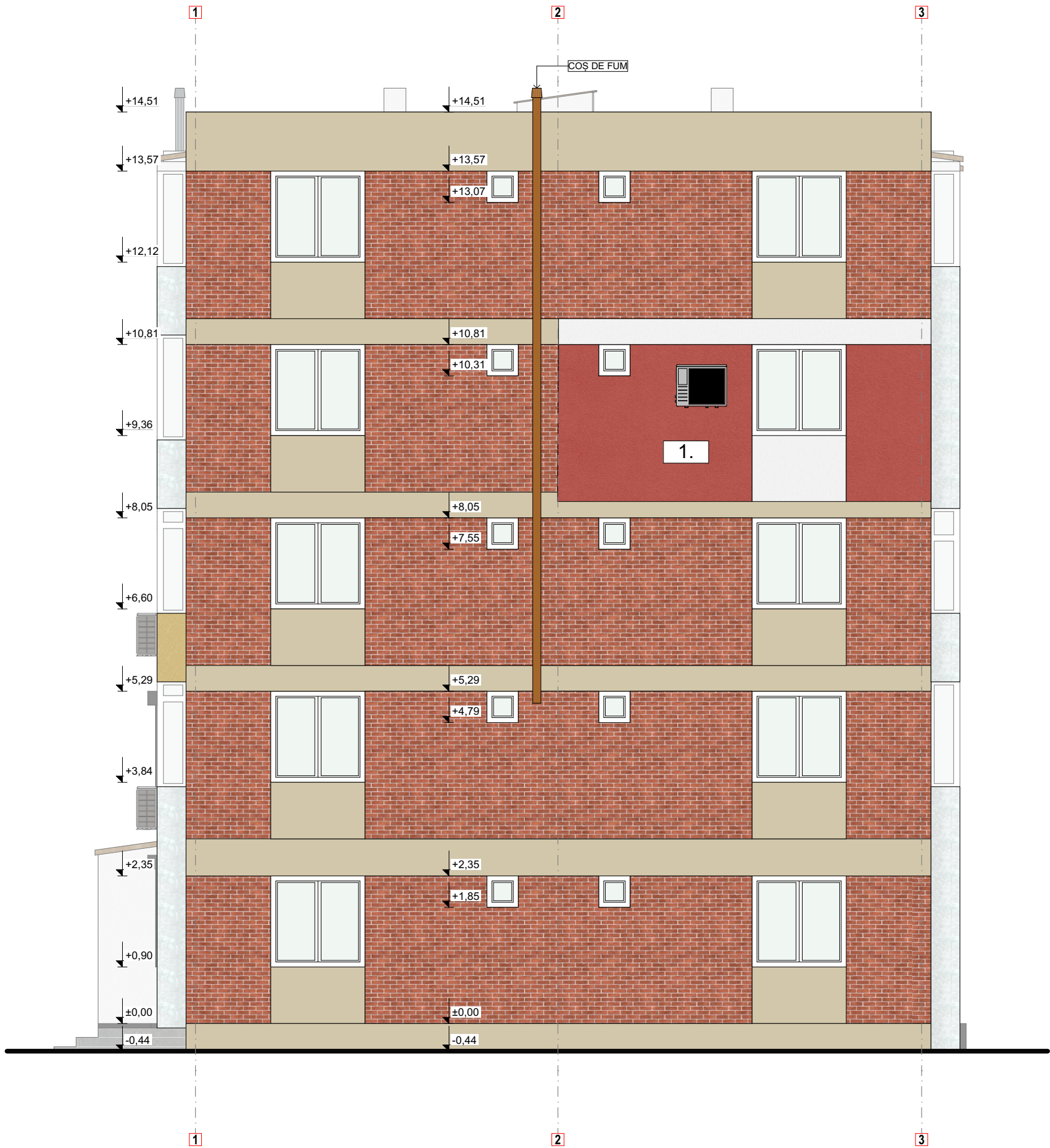
FAȚADĂ NORD, SC. 1:50